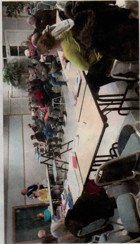
Les élus réunis autour de la table du conseil.

Le conseil municipal s'est réuni mercredi 22 février. Outre la démission du 1 er adjoint, la séance a été marquée par l'intervention du maire concernant le Plan de prévention des risques naturels.